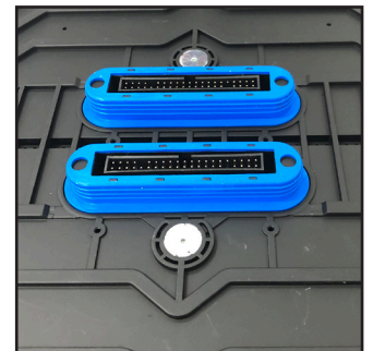
Zusatzdichtungen erhöhen die Wasserdichtheit