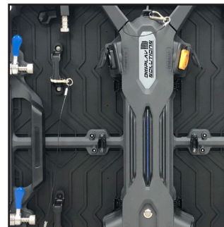
Sicherheitsdrähte zwischen Modulen als Absturzsicherung