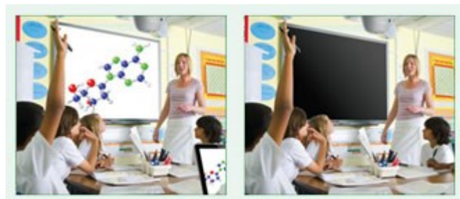
Eco AV Mute Funktion aus 100% Stromverbrauch

Behalten Sie während Ihrer Präsentation mit der ECO-AV-Mute-Funktion die Kontrolle. Richten Sie die Aufmerksamkeit Ihres Publikums durch Ausblenden weg von der Leinwand, wenn das Bild nicht benötigt wird. Dies reduziert den Stromverbrauch unmittelbar um 70%, und verlängert darüber hinaus die Lebensdauer Ihrer Lampe.