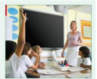
Eco AV Mute Funktion an 25% Stromverbrauch