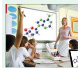
Eco AV Mute Funktion aus 100% Stromverbrauch

Behalten Sie während Ihrer Präsentation mit der ECO-AV-Mute-Funktion die Kontrolle. Richten Sie die Aufmerksamkeit Ihres Publikums durch Ausblenden weg von der Leinwand, wenn das Bild nicht benötigt wird. Dies reduziert den Stromverbrauch unmittelbar um bis zu 70%, und verlängert darüber hinaus die Lebensdauer Ihrer Lampe.